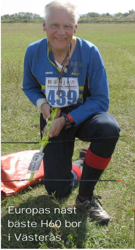
Europas näst bästa H60 bor i Västerås